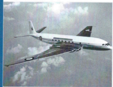
1 er vol du De Havilland DH 106 Comet