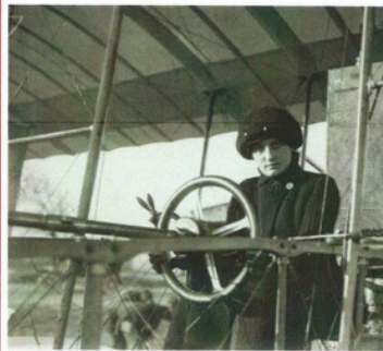
Elisa Léontine Deroche, 1 ère femme à obtenir le brevet de pilote-aviateur