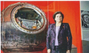
La russe Valentina Tereshkova devient la première femme dans l'espace, le 14 juin (seule à bord sur Vostok 6).