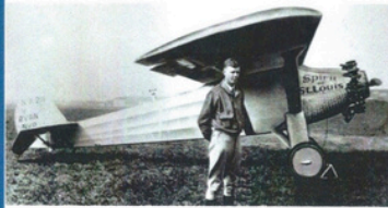
L'Américain Charles Lindbergh effectue la 1 ère traversée, sans escale, de New York au Bourget, du 20 au 21 mai, avec son avion Spirit of St Louis (sans radio). 5780 km en 33h 30 min. Il remporte le « Prix Orteig » (25 000$).