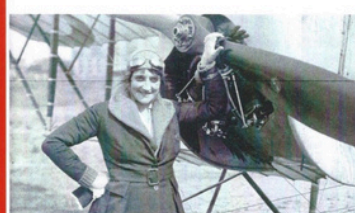
Elisa Léontine Deroche, connue sous le pseudonyme baronne Raymonde de Laroche , la française est la 1 ère femme au monde à obtenir son brevet de pilote (le n°36) le 8 mars.