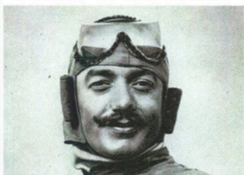
Le Français Adolphe Pégoud réalise le 1 er vol sur le dos "tête en bas" (1 er sept.) et la 1 ère boucle (looping, le 21 sept.) aux commandes d'un Blériot.