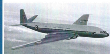
1 er vol du De Havilland DH 106 Comet le 27 juillet, mis en service en 1952, 1 er avion de ligne à réaction de l'aviation civile, équipé de 2 paires de turbo-réacteurs, d'un fuselage pressurisé.