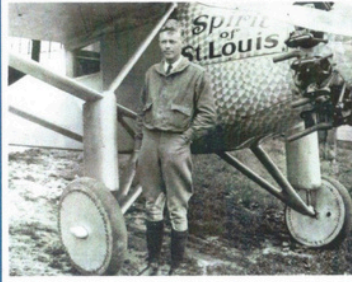
1 ère traversée de l'Atlantique Nord sans escale de New York au Bourget