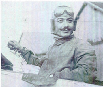
1 ère boucle et vol sur le dos par un Français