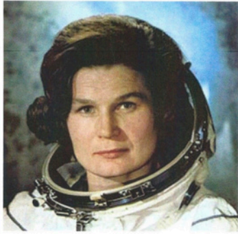
1 ère femme dans l'espace