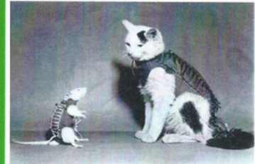
Hector le rat français de l'espace