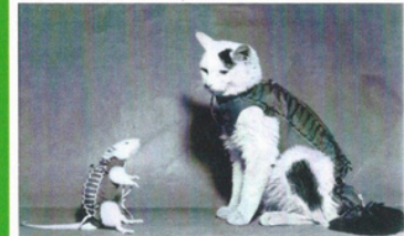
Le 22 février, le CERMA lançait la fusée Véronique emportant Hector, 1 er rat français de l'espace (revenu vivant), il sera suivi du chat Félicette en 1963.